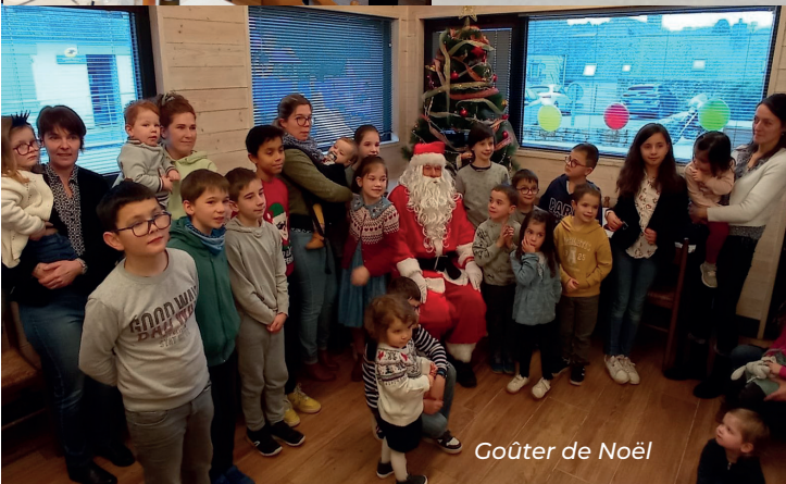
Goûter de Noël