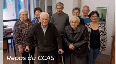
Repas du CCAS