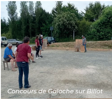
Concours de Galoche sur Billot