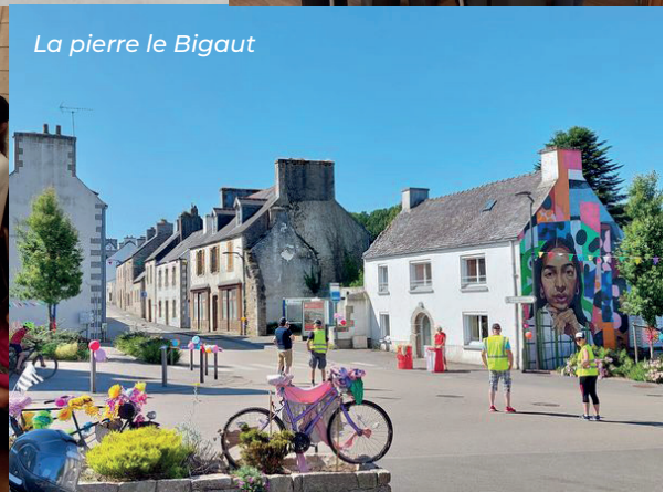
La pierre le Bigaut