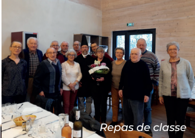
Repas de classe