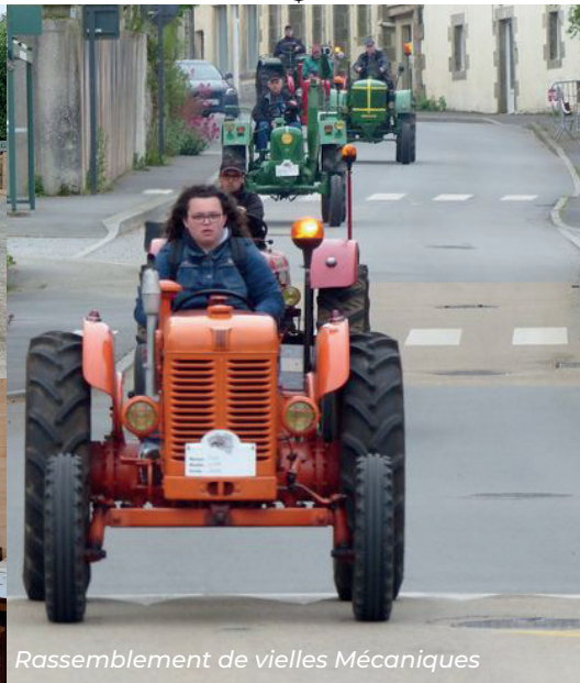
Rassemblement de vieilles Mécaniques